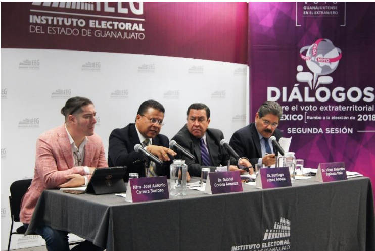
Diálogos sobre el voto extraterritorial en México: rumbo a la elección de 2018, segunda sesión, panel de análisis sobre el voto extraterritorial. Instituto Electoral del Estado de Guanajuato, 4 de agosto de 2017.