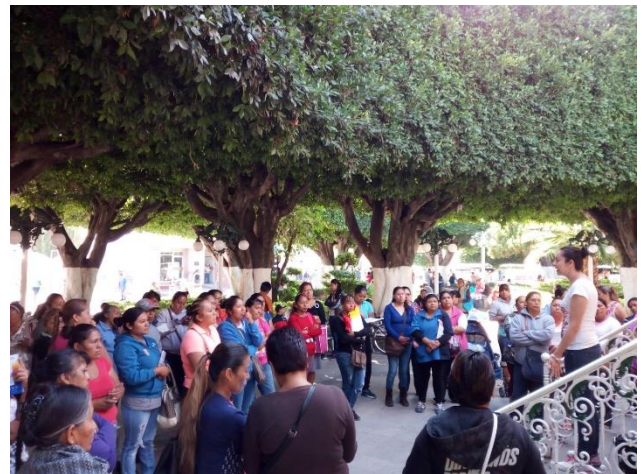
Plática de sensibilización de la campaña “Credencialízate y activa tu INE desde el extranjero”. Jardín Principal, Comonfort, 8 de agosto de 2017.