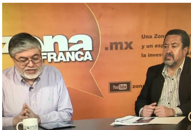
Difusión sobre el tema de la credencialización desde el extranjero, Revista de la UNA, Zona Franca, León, 18 de julio de 2017.