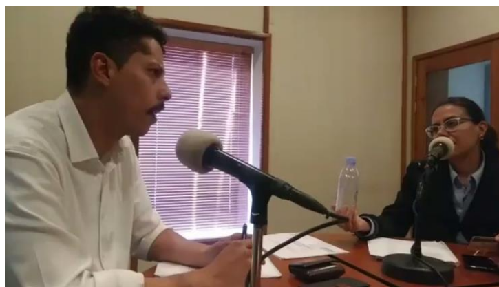
Difusión sobre el tema de la credencialización desde el extranjero, "Libertades", Radio Universidad, Guanajuato, 10 de agosto de 2017.