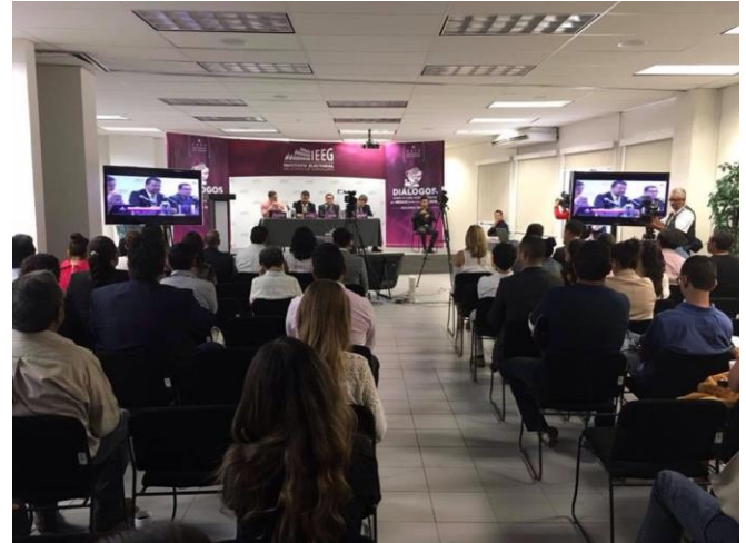
Diálogos sobre el voto extraterritorial en México: rumbo a la elección de 2018, segunda sesión, panel de análisis sobre el voto extraterritorial. Instituto Electoral del Estado de Guanajuato, 4 de agosto de 2017.