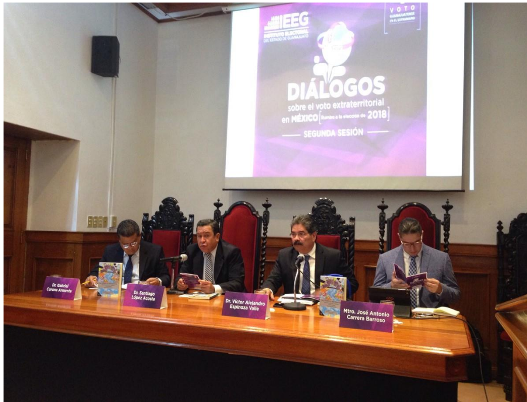
Diálogos sobre el voto extraterritorial en México: rumbo a la elección de 2018, segunda sesión, presentación del libro “El voto a distancia. Derechos políticos, ciudadanía y nacionalidad. Experiencias locales”. Universidad de Guanajuato, 3 de agosto de 2017.