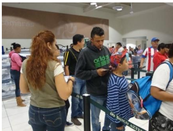
Distribución de folletos sobre el tema de la credencialización desde el extranjero. Elektra, Acámbaro, 11 de julio de 2017.