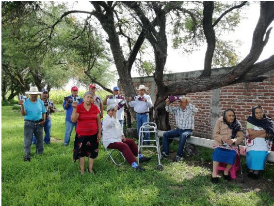
Plática de sensibilización de la campaña “Credencialízate y activa tu INE desde el extranjero”. Rancho Seco, Valle de Santiago, 15 de agosto de 2017.