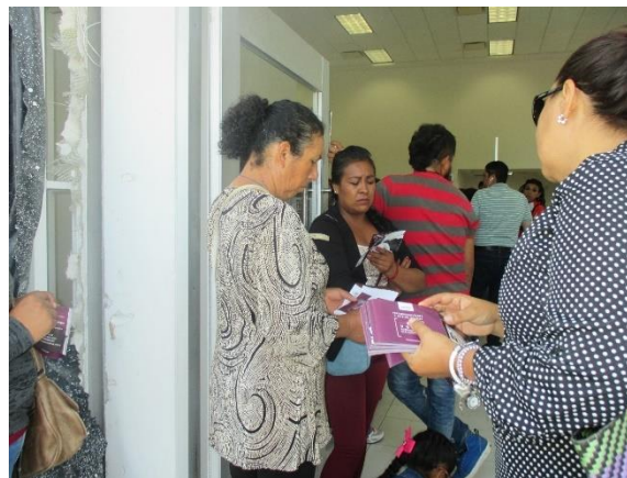
Distribución de folletos sobre el tema de la credencialización desde el extranjero. Banco Banorte, San Miguel de Allende, 15 de agosto de 2017.