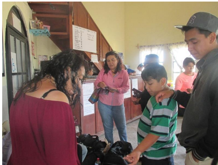
Distribución de folletos sobre el tema de la credencialización desde el extranjero. Central de Autobuses San Miguel bus line, S. A. de C. V., San Miguel de Allende, 9 de agosto de 2017.