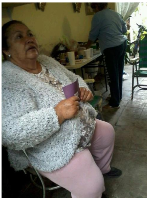
Reunión con delegada municipal para difundir el tema de la credencialización desde el extranjero, San Juan de los Duran, Silao de la Victoria, 21 de agosto de 2017.