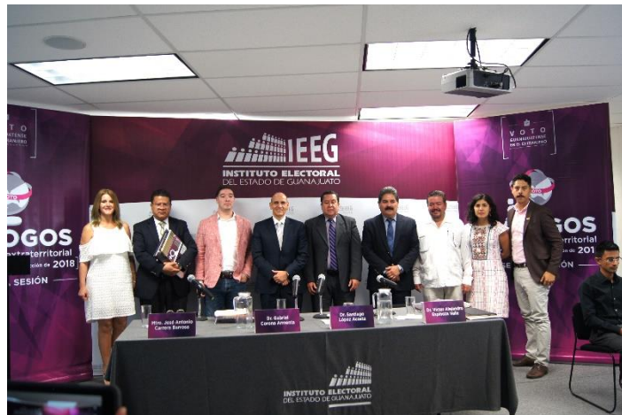
Diálogos sobre el voto extraterritorial en México: rumbo a la elección de 2018, segunda sesión, panel de análisis sobre el voto extraterritorial. Instituto Electoral del Estado de Guanajuato, 4 de agosto de 2017.