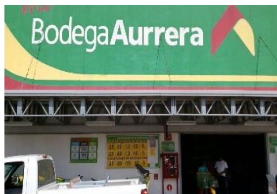
Distribución de folletos sobre el tema de la credencialización desde el extranjero, Bodega Aurrera, Manuel Doblado, 31 de octubre de 2017.