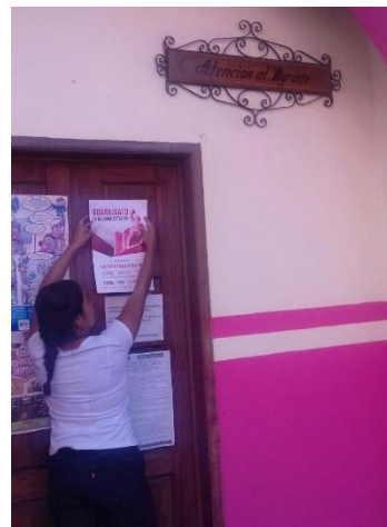
Entrega de folletos y colocación de carteles sobre el tema de la credencialización desde el extranjero, Oficina de Atención al Migrante, San Diego de la Unión, 13 de noviembre de 2017.