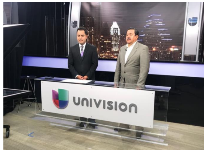
Difusión sobre el tema de la credencialización y el registro a la Lista Nominal de Electores Residentes en el Extranjero, Univisión Austin, Austin, Texas, 8 de noviembre de 2017.