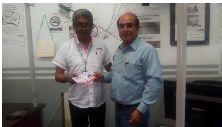
Entrega de folletos y colocación de carteles sobre el tema de la credencialización desde el extranjero, Junta Distrital Ejecutiva 11 del Instituto Nacional Electoral, León, 7 de noviembre de 2017.