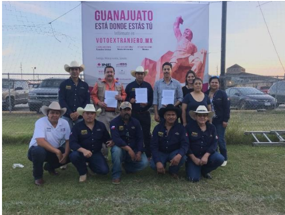
Firma de convenio entre el Instituto Electoral del Estado de Guanajuato y la organización de migrantes denominada Federación Gran Casa Guanajuato, Houston, Texas 4 de noviembre de 2017.