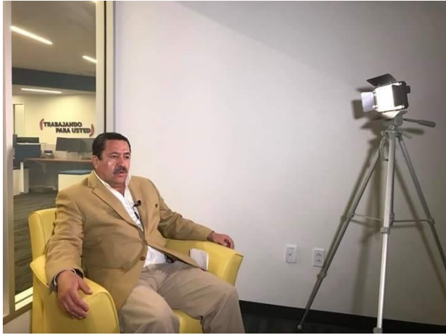
Difusión sobre el tema de la credencialización y el registro a la Lista Nominal de Electores Residentes en el Extranjero, Telemundo San Antonio, San Antonio, Texas, 7 de noviembre de 2017.