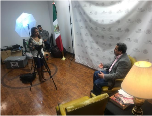
Difusión sobre el tema de la credencialización y el registro a la Lista Nominal de Electores Residentes en el Extranjero, Mundo Hispano de Dallas, Dallas, Texas, 9 de noviembre de 2017.