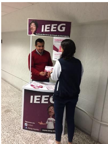
Stand informativo sobre el tema de la credencialización desde el extranjero, Universidad de la Salle Bajío, León, 30 de octubre de 2017.