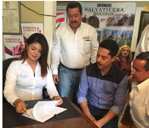
Firma de convenio entre el Instituto Electoral del Estado de Guanajuato y el Grupo Salvatierra Guanajuato Houston, Houston, Texas, 4 de noviembre de 2017.