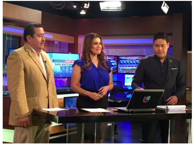
Difusión sobre el tema de la credencialización y el registro a la Lista Nominal de Electores Residentes en el Extranjero, Univisión San Antonio, San Antonio, Texas, 7 de noviembre de 2017.