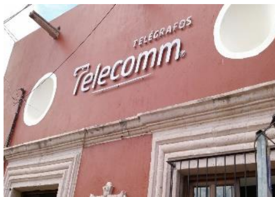
Distribución de folletos sobre el tema de la credencialización desde el extranjero. Telecomm, Manuel Doblado, 31 de octubre de 2017.