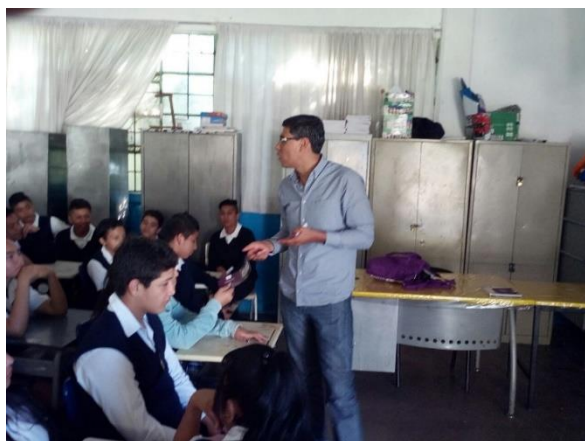
Plática de sensibilización sobre el tema de la credencialización desde el extranjero, Telesecundaria No. 239, Irapuato, 7 de noviembre de 2017.