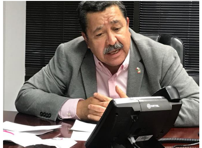
Difusión sobre el tema de la credencialización y el registro a la Lista Nominal de Electores Residentes en el Extranjero, Programa radiofónico “Con Sal” de Francisco Rayo, Dallas, Texas, 9 de noviembre de 2017.