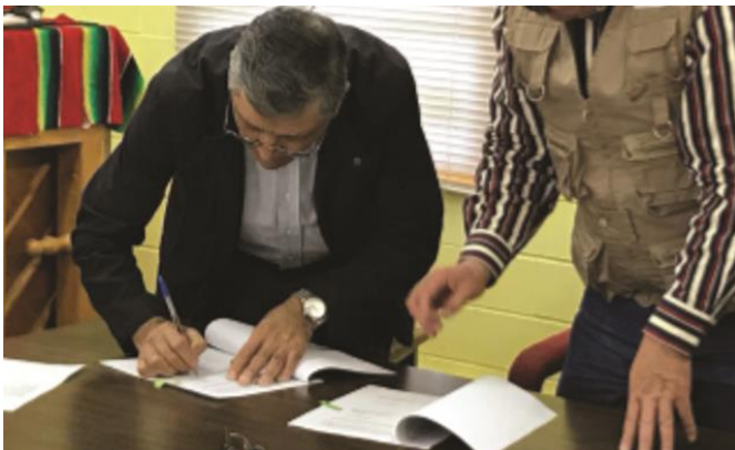
Firma de convenio entre el Instituto Electoral del Estado de Guanajuato y la organización no lucrativa Dallas México Casa Guanajuato, Dallas, Texas, 11 de noviembre de 2017.