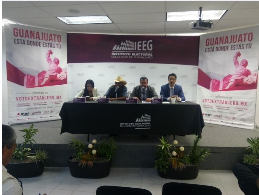
Rueda de prensa de la firma de convenio entre el Instituto Electoral del Estado de Guanajuato (IEEG) y el Instituto Estatal de Atención al Migrante Guanajuatense y sus Familias, Instituto Electoral del Estado de Guanajuato, Guanajuato, 22 de noviembre de 2017.