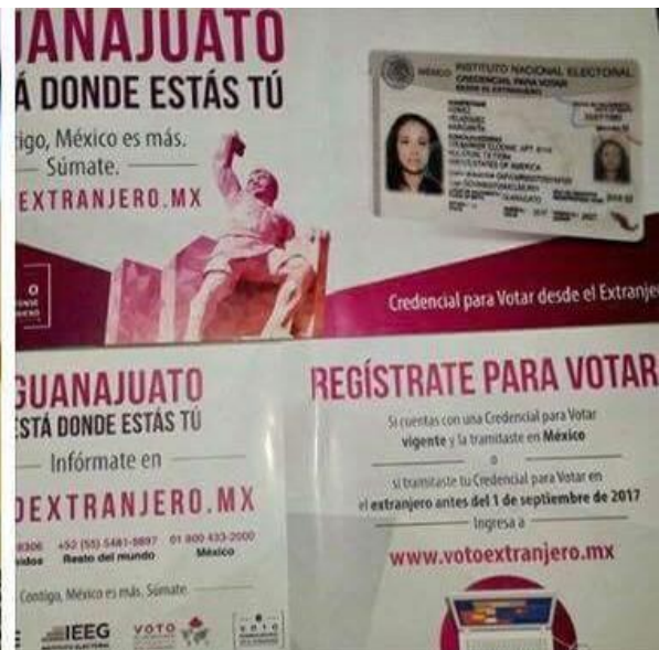
Entrega de folletos y de carteles sobre el tema de la credencialización desde el extranjero, Consulado general de México en Houston, Grupo Salvatierra Houston, Houston, 22 de noviembre de 2017.