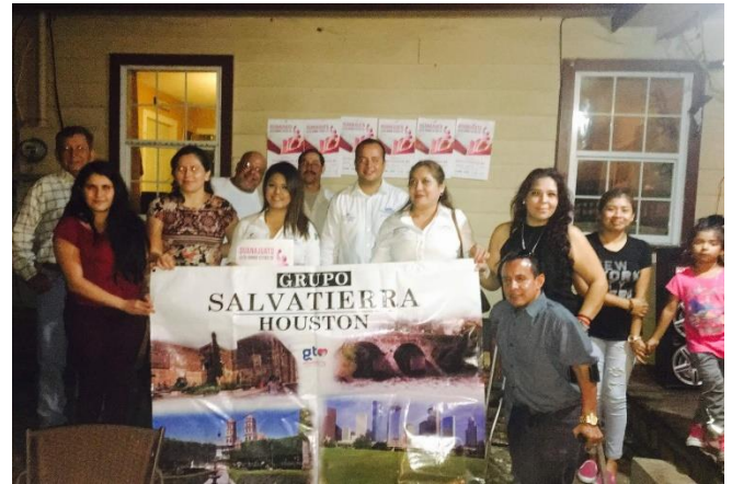
Plática de sensibilización sobre el tema de la credencialización desde el extranjero, Grupo Salvatierra Houston, Houston, 12 de noviembre de 2017.