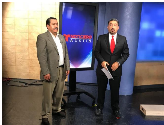
Difusión sobre el tema de la credencialización y el registro a la Lista Nominal de Electores Residentes en el Extranjero, Telemundo Austin, Austin, Texas, 8 de noviembre de 2017.