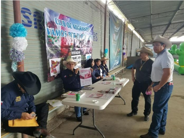
Entrega de folletos y de carteles sobre el tema de la credencialización desde el extranjero, Federación Gran Casa Guanajuato, Houston, 12 de noviembre de 2017.