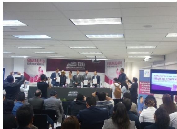
Firma de convenio entre el Instituto Electoral del Estado de Guanajuato y el Instituto Estatal de Atención al Migrante Guanajuatense y sus Familias, Instituto Electoral del Estado de Guanajuato, Guanajuato, 22 de noviembre de 2017.