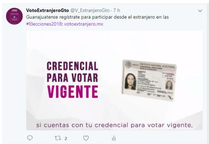
Tramita tu credencial. Voto de los Guanajuatenses Residentes en el Extranjero, Twitter , octubre de 2017.