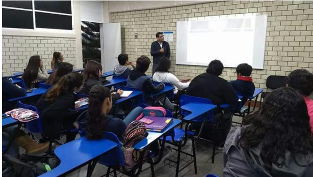
Plática de sensibilización sobre el tema de la credencialización desde el extranjero, Instituto Irapuato, Irapuato, 17 de octubre de 2017.