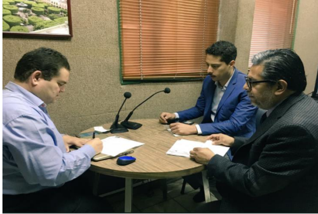
Difusión sobre el tema de la credencialización y el registro a la Lista Nominal de Electores Residentes en el Extranjero, Línea Directa, 17 de octubre de 2017.