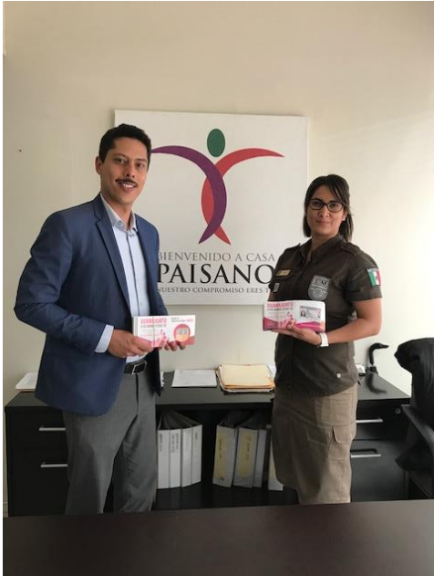
Entrega de folletos sobre el tema de la credencialización y registro en la LNERE, oficina del INM, León, 17 de octubre de 2017.