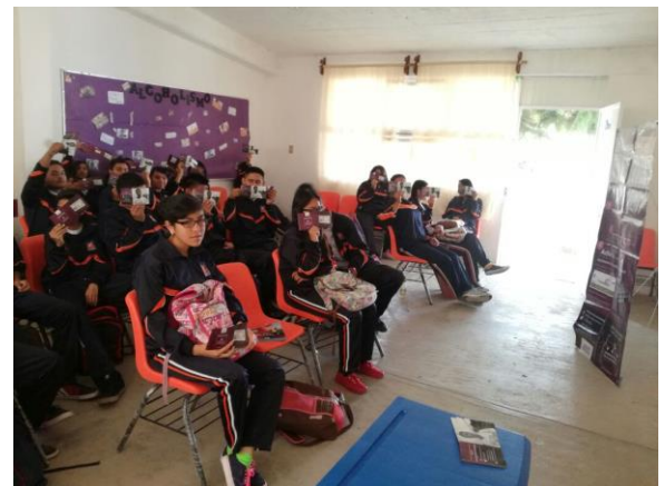
Plática de sensibilización sobre el tema de la credencialización desde el extranjero, Comunidad El Perico, Valle de Santiago, 19 de octubre de 2017.