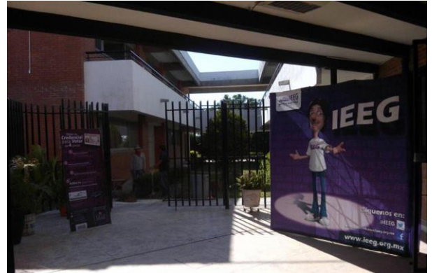
Stand informativo sobre el tema de la credencialización desde el extranjero, Oficina del Consejo Distrital, León, 15 de octubre de 2017.