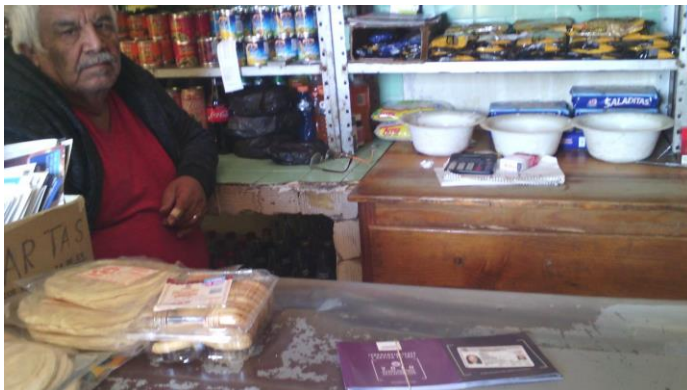
Se brindó información sobre la credencialización desde el extranjero, Comunidad de Calderón en San Miguel de Allende, 26 de octubre de 2017.