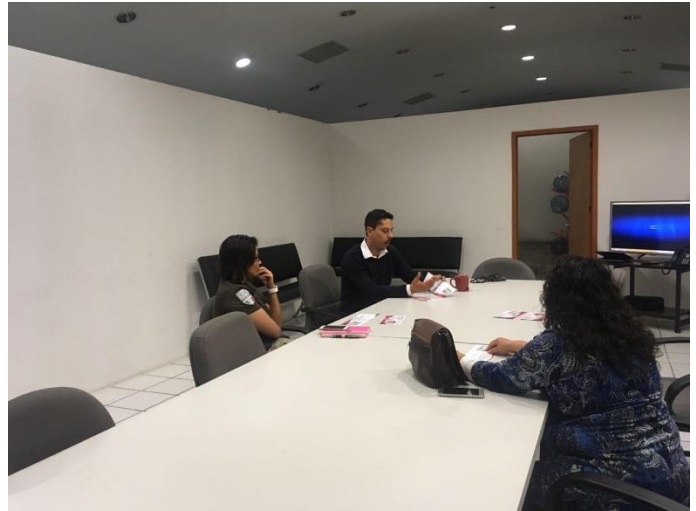
Capacitación sobre el tema de la credencialización y registro en la LNERE, oficina del INM, León, 24 de octubre de 2017.