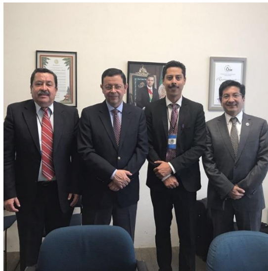
Reunión con el embajador y director del Instituto de los Mexicanos en el Exterior, Secretaría de Relaciones Exteriores, Ciudad de México, 18 de octubre de 2017.