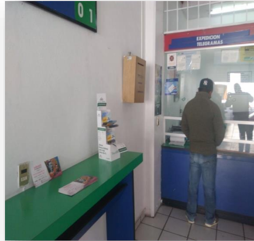
Entrega de folletos sobre el tema de la credencialización desde el extranjero y registro a la Lista Nominal de Electores Residentes en el Extranjero para su distribución, Telecom-Telegrafos Pénjamo, 1 de diciembre de 2017.