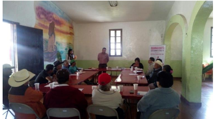
Plática informativa sobre el tema de la credencialización desde el extranjero y registro a la Lista Nominal de Electores Residentes en el Extranjero, Centro de convivencias "El Encino", Guanajuato, 07 de diciembre de 2017.