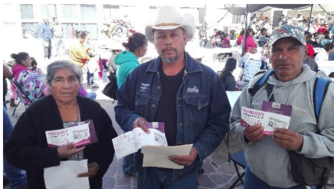
Plática informativa sobre el tema de la credencialización desde el extranjero y registro a la Lista Nominal de Electores Residentes en el Extranjero, Centro de Desarrollo Comunitario, San Luis de la Paz, 1 de diciembre de 2017.