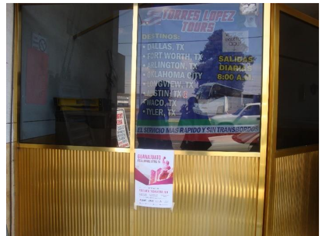
Distribución de folletos y colocación de cartel sobre el tema de la credencialización desde el extranjero y registro a la Lista Nominal de Electores Residentes en el Extranjero, Transportes Torres López, Salamanca, 15 de diciembre de 2017.