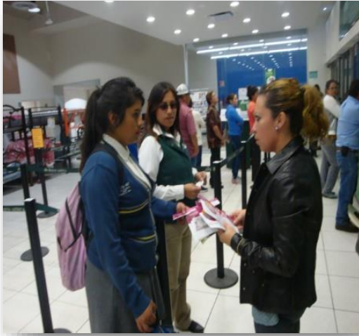
Distribución de folletos sobre el tema de la credencialización desde el extranjero y registro a la Lista Nominal de Electores Residentes en el Extranjero, Elektra, Acámbaro, 30 de noviembre de 2017.