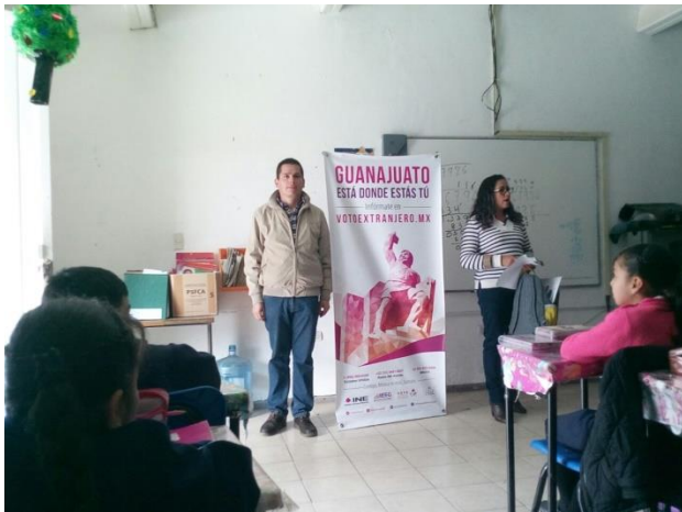
Plática informativa sobre el tema de la credencialización desde el extranjero y registro a la Lista Nominal de Electores Residentes en el Extranjero, Escuela Primaria Rural Miguel Hidalgo, Irapuato, 14 de diciembre de 2017.