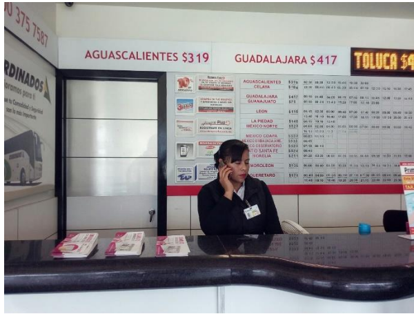
Distribución de folletos y colocación de cartel sobre el tema de la credencialización desde el extranjero y registro a la Lista Nominal de Electores Residentes en el Extranjero, Central de Autobuses, Irapuato, 14 de diciembre de 2017.