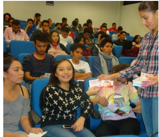
Plática informativa sobre el tema de la credencialización desde el extranjero y registro a la Lista Nominal de Electores Residentes en el Extranjero, Universidad Tecnológica de Salamanca, Salamanca, 6 de diciembre de 2017.