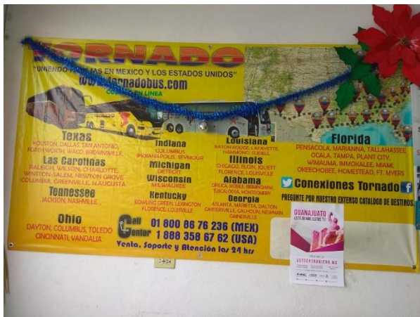
Distribución de folletos y colocación de cartel sobre el tema de la credencialización desde el extranjero y registro a la Lista Nominal de Electores Residentes en el Extranjero, Agencia de pasajeros "Tornado", Celaya, 14 de diciembre de 2017.