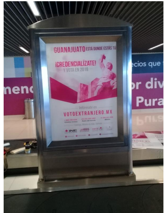
Publicidad sobre el tema de la credencialización desde el extranjero y registro a la Lista Nominal de Electores Residentes en el Extranjero, Aeropuerto Internacional del Bajío, Guanajuato, diciembre de 2017.