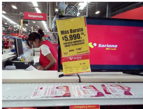
Entrega de folletos sobre el tema de la credencialización desde el extranjero y registro a la Lista Nominal de Electores Residentes en el Extranjero para su distribución, Soriana, Irapuato, 14 de diciembre de 2017.