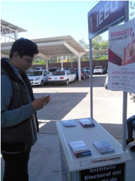
Stand informativo sobre el tema de la credencialización desde el extranjero y registro a la Lista Nominal de Electores Residentes en el Extranjero, Secretaría del Trabajo y Previsión Social, León, 27 de noviembre de 2017.