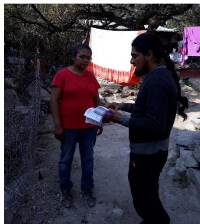
Plática informativa sobre el tema de la credencialización desde el extranjero y registro a la Lista Nominal de Electores Residentes en el Extranjero, Comunidad de la Huerta, San Miguel de Allende, 7 de diciembre de 2017.