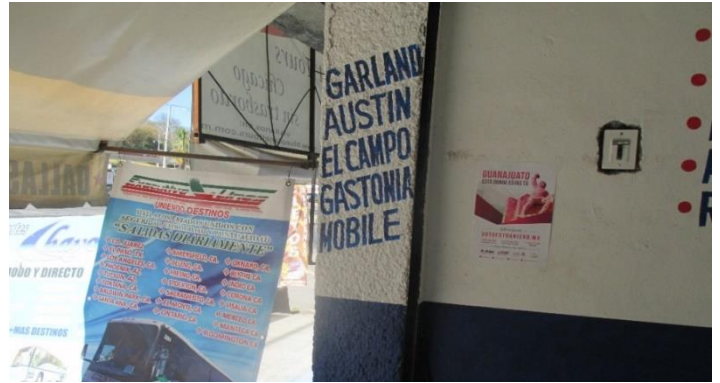
Distribución de folletos y colocación de cartel sobre el tema de la credencialización desde el extranjero y registro a la Lista Nominal de Electores Residentes en el Extranjero, Agencia de pasajeros "El Paisano", Uriangato, 27 de noviembre de 2017.