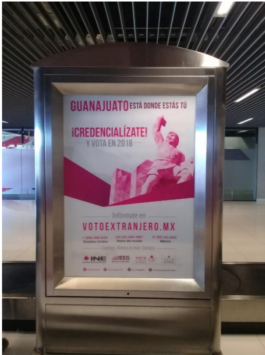
Publicidad sobre el tema de la credencialización desde el extranjero y registro a la Lista Nominal de Electores Residentes en el Extranjero, Aeropuerto Internacional del Bajío, Guanajuato, diciembre de 2017.