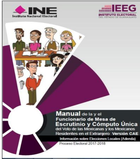
Manual de la y el Funcionamiento de Mesa de Escrutinio y Cómputo Única del voto de las mexicanas y mexicanos residentes en el Extranjero