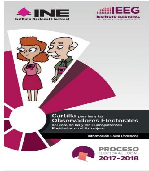
Cartilla para las y los Observadores Electorales de las y los Guanajuatenses residentes en el Extranjero.

Y se encuentran en proceso de validación 3 :