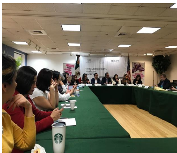
Encuentro "El Voto de las Mujeres Migrantes" en el Consulado General de México en Chicago, 16 de marzo de 2018.