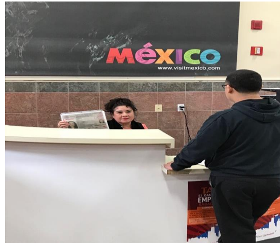
Feria de registros en Consulado General de México en Chicago, 17 de marzo de 2018.