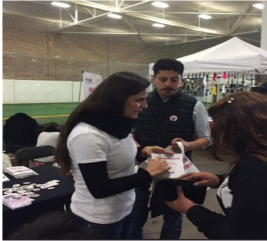
Feria de registros en Carnitas Fest, Chicago Sport Complex (2600 W. 35th St, Chicago III), Develación Street Art en La Villita (3610 W.26th Street, Chicago, III), 18 de marzo de 2018.