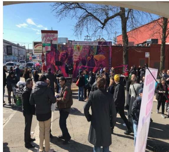
Develación Street Art en La Villita (3610 W.26th Street, Chicago, Ill), 17 de marzo de 2018.