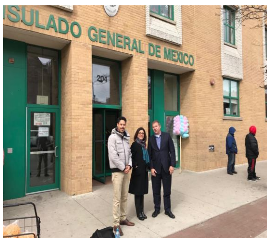
Feria de registros en el Consulado General de México en Chicago, 16 de marzo de 2018.