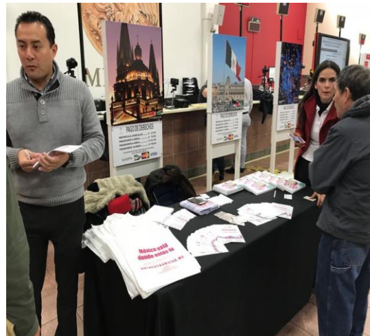
Feria de registros en Carnitas Fest, Chicago Sport Complex (2600 W. 35th St, Chicago III), Develación Street Art en La Villita (3610 W.26th Street, Chicago, III), 18 de marzo de 2018.