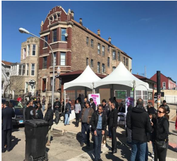
Develación Street Art en La Villita (3610 W.26th Street, Chicago, Ill), 17 de marzo de 2018.