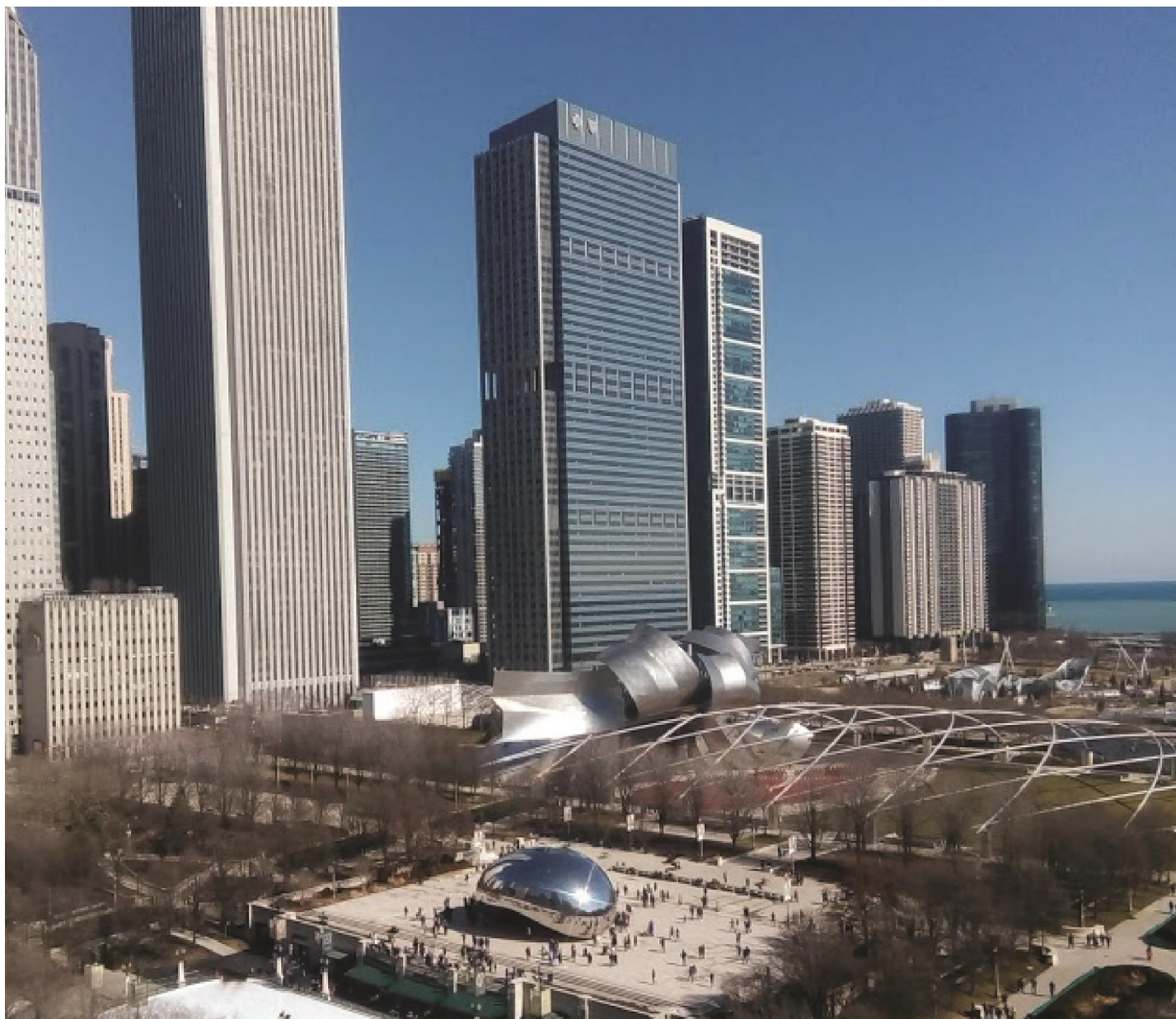
Imagen: Millenium Park, Chicago Illinois, EUA.