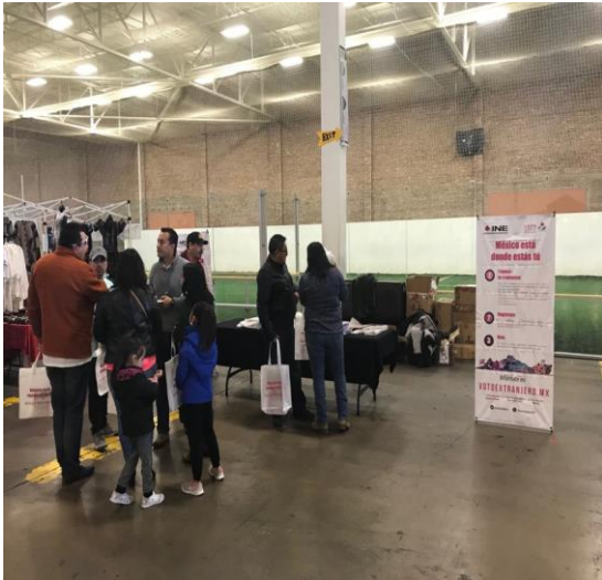
Feria de registros en Carnitas Fest, Chicago Sport Complex (2600 W. 35th St, Chicago III), Develación Street Art en La Villita (3610 W.26th Street, Chicago, III), 18 de marzo de 2018.