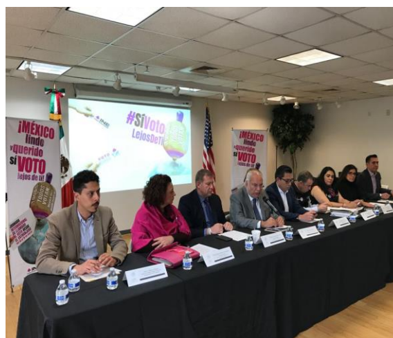
Conferencia de prensa en el Consulado General de México en Chicago, 16 de marzo de 2018.