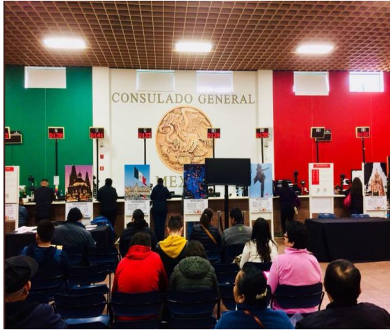
Feria de registros en el Consulado General de México en Chicago, 17 de marzo de 2018.