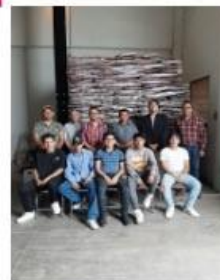
Equipo de Trabajo