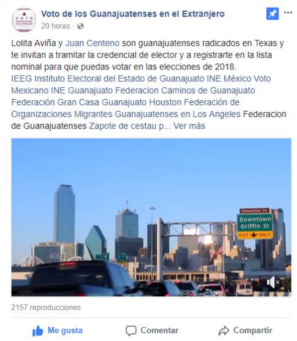
Historia de migrantes. Voto de los Guanajuatenses Residentes en el Extranjero. Facebook , febrero de 2018.