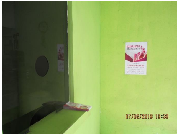
Distribución de folletos y colocación de cartel sobre el tema de la credencialización desde el extranjero y registro a la Lista Nominal de Electores Residentes en el Extranjero, Casa de cambio, Uriangato, 7 de febrero de 2018.