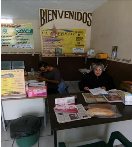
Entrega de folletos para su distribución y colocación de cartel sobre el tema de la credencialización desde el extranjero y registro a la Lista Nominal de Electores Residentes en el Extranjero, Autobuses Tornado y el Conejo, Santa Ana Pacueco, Pénjamo, 24 de enero de 2018.