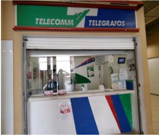
Distribución de folletos y colocación de cartel sobre el tema de la credencialización desde el extranjero y registro a la Lista Nominal de Electores Residentes en el Extranjero, Telecom Telégrafos, Abasolo, 8 de febrero de 2018.