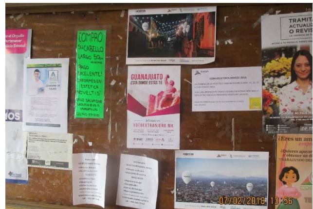
Colocación de cartel para la promoción del tema de la credencialización desde el extranjero y registro a la Lista Nominal de Electores Residentes en el Extranjero, Espacios públicos, Uriangato, 7 de febrero de 2018.