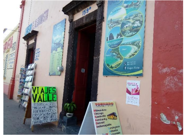
Entrega de folletos para su distribución y colocación de cartel sobre el tema de la credencialización desde el extranjero y registro a la Lista Nominal de Electores Residentes en el Extranjero, Agencia de viajes Valle, Valle de Santiago, 9 de febrero de 2018.