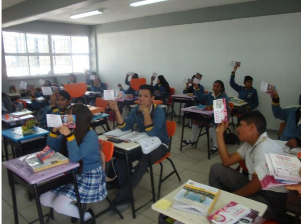
Plática sobre el tema de la credencialización desde el extranjero y registro a la Lista Nominal de Electores Residentes en el Extranjero, Escuela Telesecundaria No 23, Salamanca, 24 de enero de 2018.