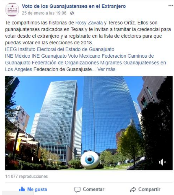
Historia de migrantes. Voto de los Guanajuatenses Residentes en el Extranjero. Facebook , febrero de 2018.