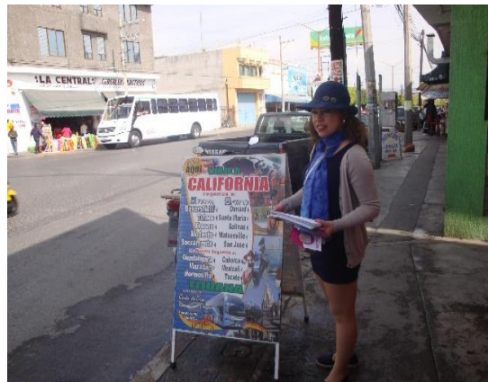
Distribución de folletos sobre el tema de la credencialización desde el extranjero y registro a la Lista Nominal de Electores Residentes en el Extranjero, Autobuses "Costa de Oro", Acámbaro, 7 de febrero de 2018.