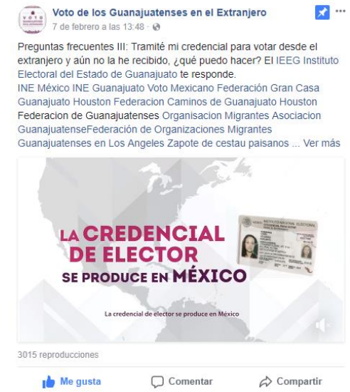
Preguntas frecuentes III. Voto de los Guanajuatenses Residentes en el Extranjero. Facebook, febrero de 2018.