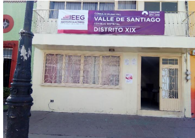
Colocación de lona para la promoción del tema de la credencialización desde el extranjero y registro a la Lista Nominal de Electores Residentes en el Extranjero, Consejo municipal y distrital, Valle de Santiago, 9 de febrero de 2018.