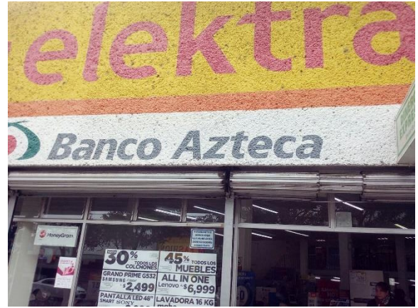
Distribución de folletos y colocación de cartel sobre el tema de la credencialización desde el extranjero y registro a la Lista Nominal de Electores Residentes en el Extranjero, Elektra, Irapuato, 29 de enero de 2018.