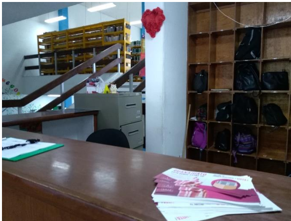
Módulo informativo sobre el tema de la credencialización desde el extranjero y registro a la Lista Nominal de Electores Residentes en el Extranjero, Biblioteca Pública Municipal, León, 8 de febrero de 2018.