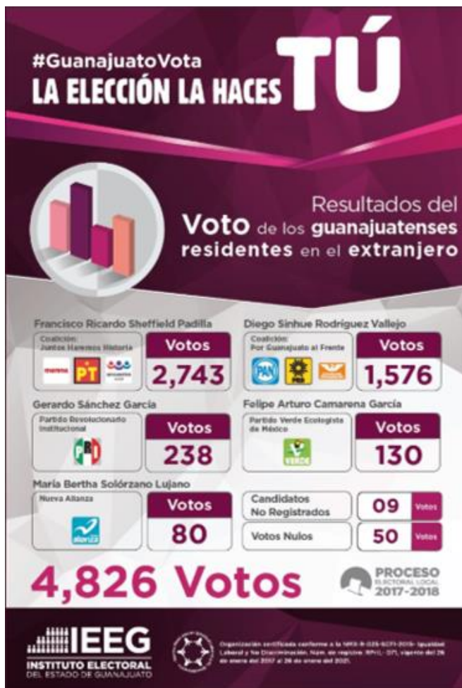
Resultados del voto de los guanajuatenses residentes en el extranjero, IEEG, julio de 2018.