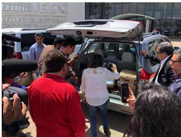
Entrega-recepción de los Paquetes Electorales y las 16 actas de mesa escrutinio y cómputo, Instituto Electoral del Estado de Guanajuato, Guanajuato, 2 de julio de 2018.