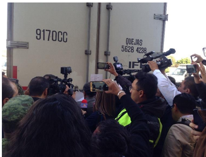
Traslado de los sobres voto al Local Único, Jornada Electoral, Bodega del INE, Ciudad de México, 1 de julio de 2018.