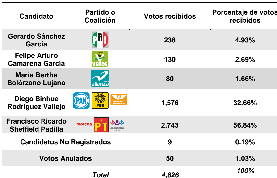
Tabla 7. Votos recibidos desde el extranjero por candidato (a) a la gubernatura de Guanajuato.