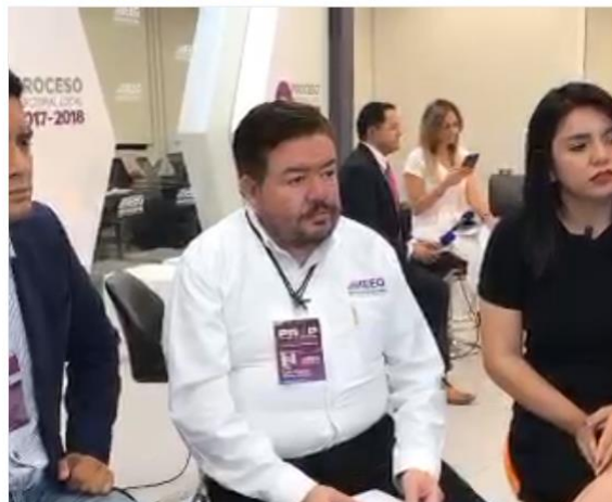
Entrevista con Espacio Guanajuato Tv sobre el voto de los guanajuatenses residentes en el extranjero, IEEG, 1 de julio de 2018.

Charlando con @SilviaMosquedaT de @EspaciogtoTV sobre el desarrollo de la #JornadaElectoral2018 2da parte. @IEEG