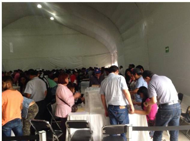
Escrutinio y cómputo del Voto de los Guanajuatenses Residentes en el Extranjero, Local Único, Jornada Electoral, Tecnológico de Monterrey, Campus Ciudad de México, 1 de julio de 2018.