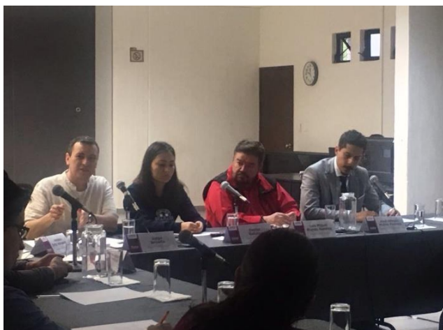
Presentación del reporte de actividades relativo a la observación electoral migrante, realizada en la Jornada Electoral del 1 de julio de 2018, IEEG, 12 de julio de 2018.