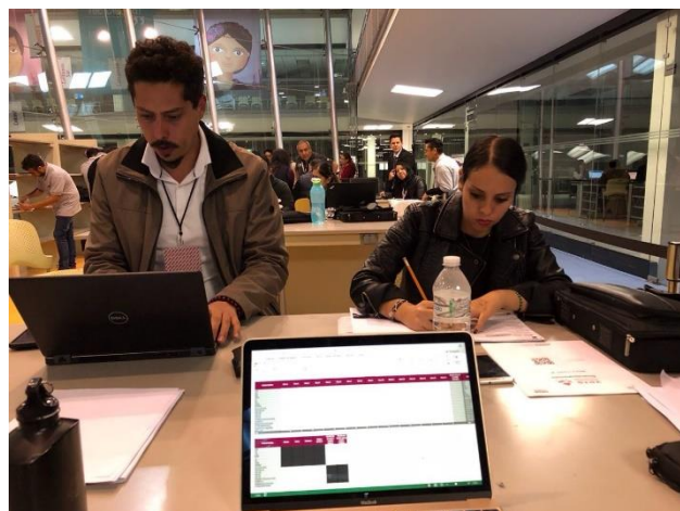
Llenado de Acta de Cómputo de Entidad Federativa de la elección para la Gubernatura, Local Único, Jornada Electoral, Tecnológico de Monterrey, Campus Ciudad de México, 2 de julio de 2018.