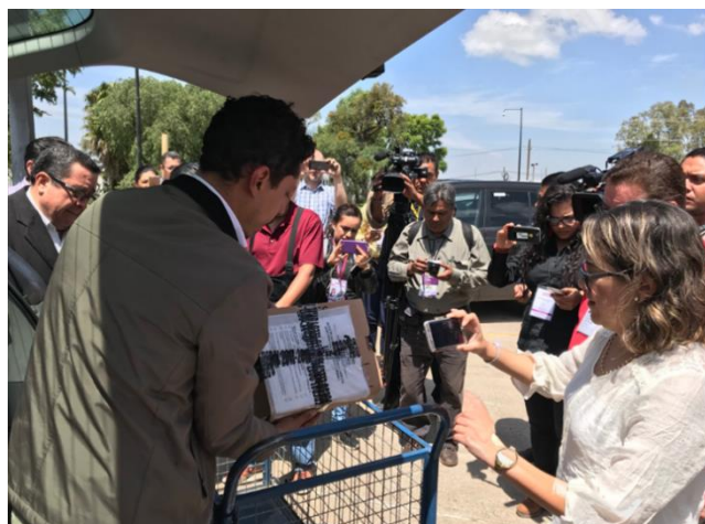
Entrega-recepción de los Paquetes Electorales y las 16 actas de mesa escrutinio y cómputo, Instituto Electoral del Estado de Guanajuato, Guanajuato, 2 de julio de 2018.