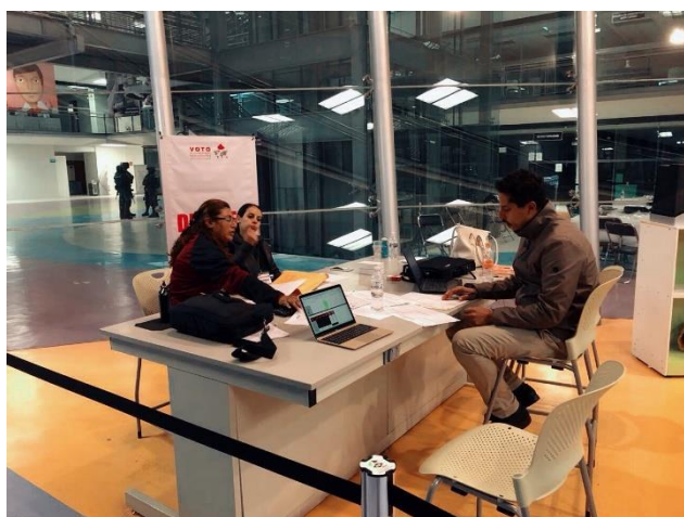
Llenado de Acta de Cómputo de Entidad Federativa de la elección para la Gubernatura, Local Único, Jornada Electoral, Tecnológico de Monterrey, Campus Ciudad de México, 2 de julio de 2018.