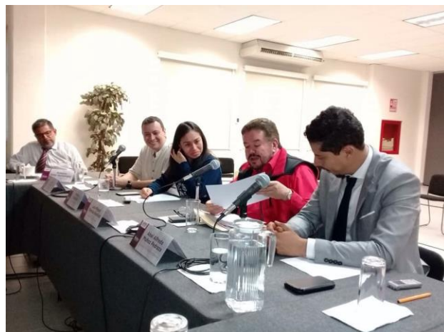
Presentación del reporte de actividades relativo a la observación electoral migrante realizada, en la Jornada Electoral del 1 de julio de 2018, IEEG, 12 de julio de 2018.