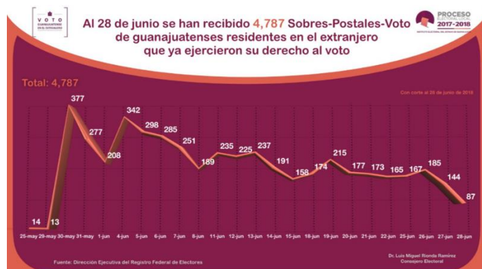
Sobres voto recibidos de los guanajuatenses residentes en el extranjero, IEEG, junio de 2018.