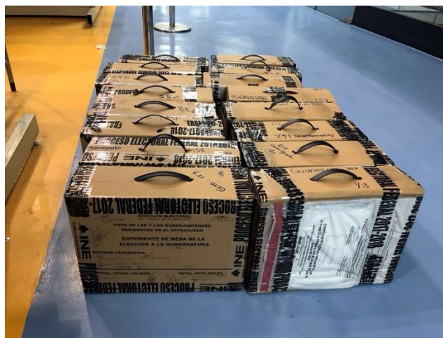
Recepción de Paquetes Electorales, Local Único, Jornada Electoral, Tecnológico de Monterrey, Campus Ciudad de México, 2 de julio de 2018.