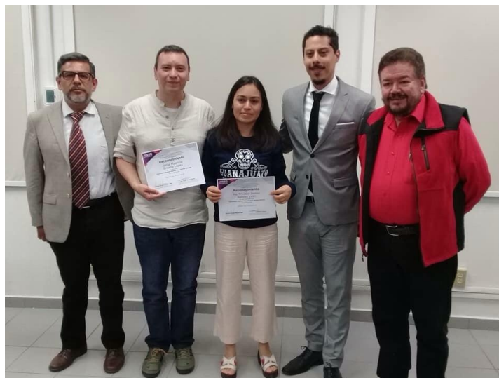
Presentación del reporte de actividades relativo a la observación electoral migrante, realizada en la Jornada Electoral del 1 de julio de 2018, IEEG, 12 de julio de 2018.