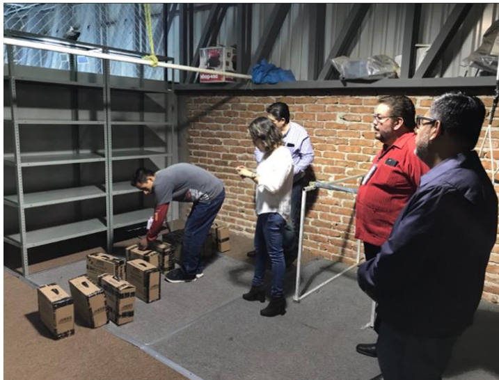
Resguardo de Paquetes Electorales, Instituto Electoral del Estado de Guanajuato, Guanajuato, 2 de julio de 2018.