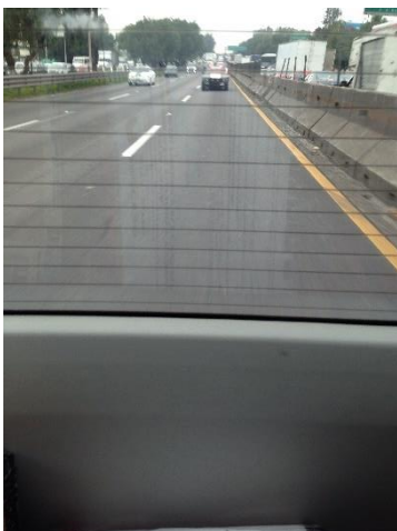
Traslado de los Paquetes Electorales, Ciudad de México-Guanajuato, 2 de julio de 2018.