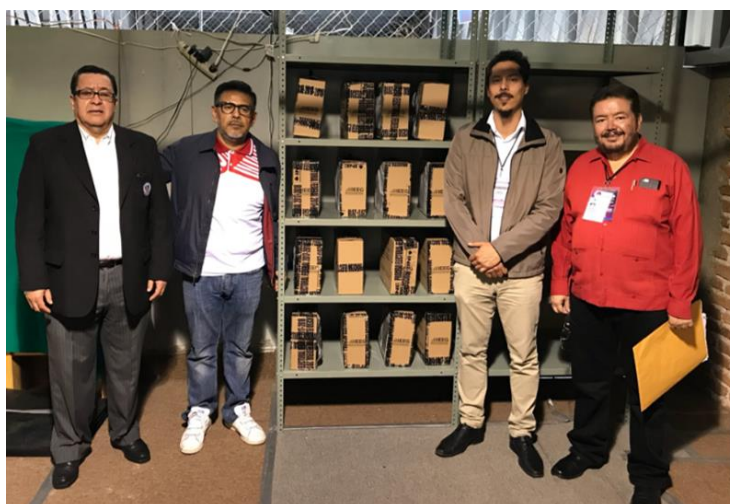
Resguardo de Paquetes Electorales, Instituto Electoral del Estado de Guanajuato, Guanajuato, 2 de julio de 2018.