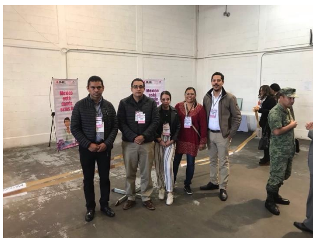
Traslado de los sobres voto al Local Único, Jornada Electoral, Bodega del INE, Ciudad de México, 1 de julio de 2018.