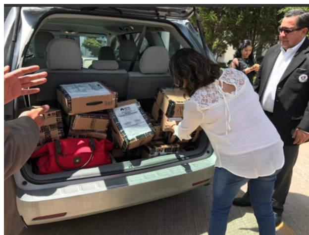
Entrega-recepción de los Paquetes Electorales y las 16 actas de mesa escrutinio y cómputo, Instituto Electoral del Estado de Guanajuato, Guanajuato, 2 de julio de 2018.