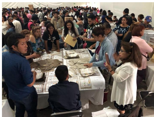
Escrutinio y cómputo del Voto de los Guanajuatenses Residentes en el Extranjero, Local Único, Jornada Electoral, Tecnológico de Monterrey, Campus Ciudad de México, 1 de julio de 2018.