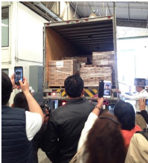
Traslado de los sobres voto al Local Único, Jornada Electoral, Bodega del INE, Ciudad de México, 1 de julio de 2018.