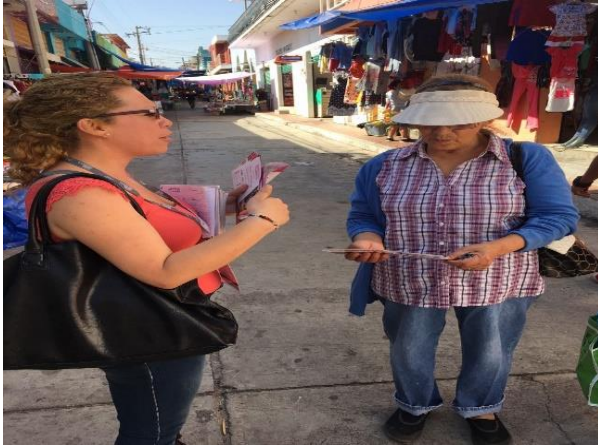
Distribución de folletos sobre el tema de la credencialización desde el extranjero y registro a la Lista Nominal de Electores Residentes en el Extranjero, Tianguis, Tarandacuao, 14 de marzo de 2018.