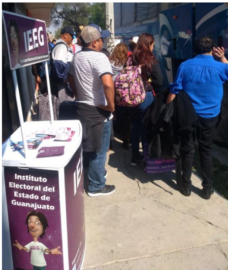
Modulo informativo sobre el tema de la credencialización desde el extranjero y registro a la Lista Nominal de Electores Residentes en el Extranjero, Central de autobuses, León, 12 de marzo de 2018.