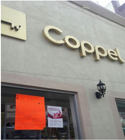
Entrega de folletos para su distribución y colocación de cartel sobre el tema de la credencialización desde el extranjero y registro a la Lista Nominal de Electores Residentes en el Extranjero, Coppel, San Diego de la Unión, 22 de febrero de 2018.