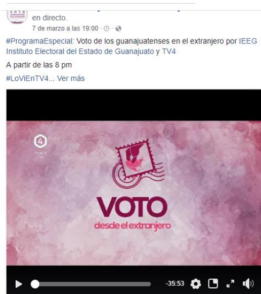
Capítulo 1 de la serie de televisión Voto de los Guanajuatenses Residentes en el Extranjero. Facebook, marzo de 2018.