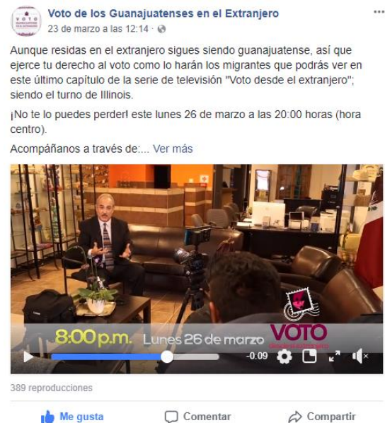
Spot promocional de la serie de televisión Voto de los Guanajuatenses Residentes en el Extranjero. Facebook, marzo de 2018.