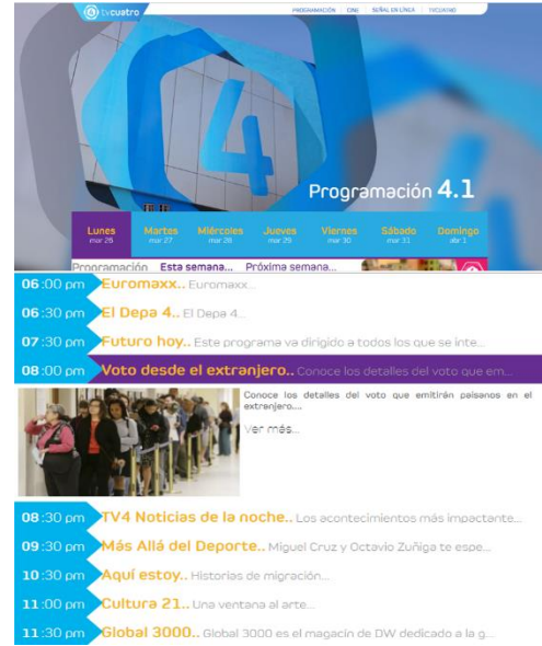
Programación de TV4, serie de televisión Voto de los Guanajuatenses Residentes en el Extranjero. Sitio web de TV4, marzo de 2018.