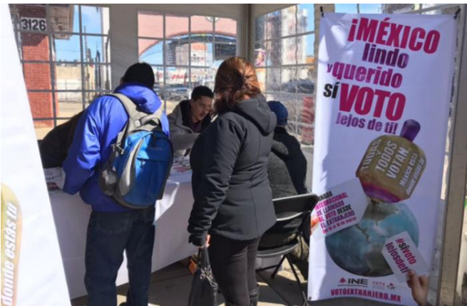
Feria de registros, Jornada Internacional del llamado al voto desde el extranjero, Consulado General de México en Chicago, Chicago, Illinois, 17 de marzo de 2018.