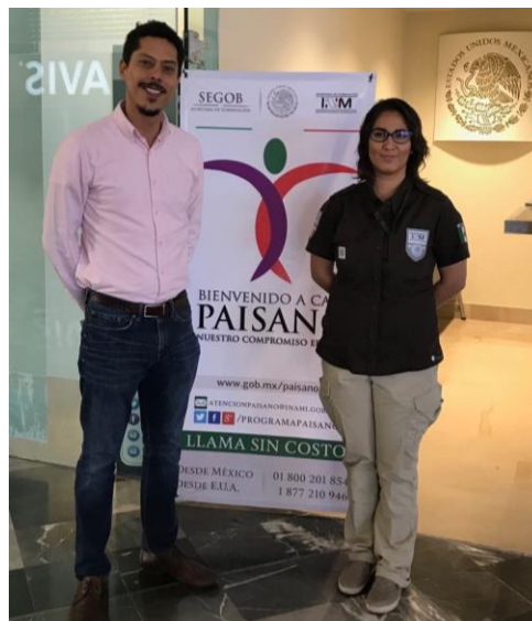
Entrega de folletos sobre el tema de la credencialización y registro a la LNERE, Oficina del INM, Municipio de León, 9 de marzo de 2018