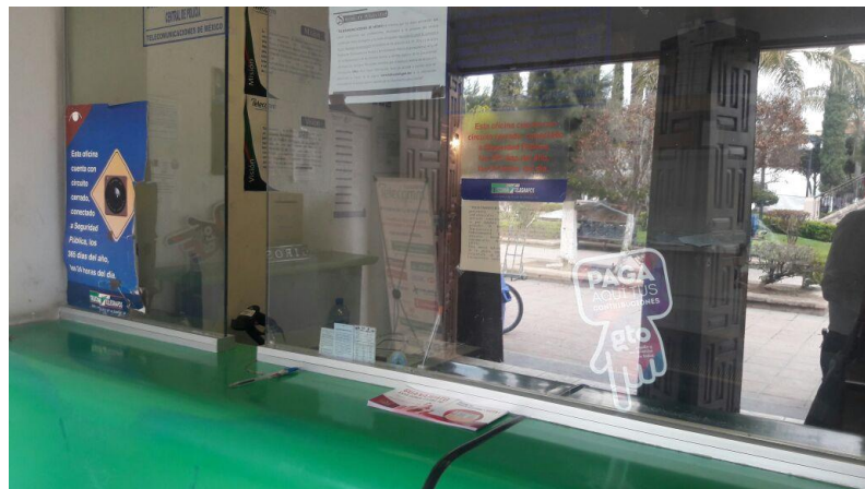
Entrega de folletos para su distribución y colocación de cartel sobre el tema de la credencialización desde el extranjero y registro a la Lista Nominal de Electores Residentes en el Extranjero, Telégrafos Telecomm, San Diego de la Unión, 22 de febrero de 2018.