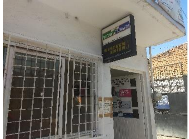
Entrega de folletos para su distribución y colocación de cartel sobre el tema de la credencialización desde el extranjero y registro a la Lista Nominal de Electores Residentes en el Extranjero, Telecomm Telecomunicaciones, Cuernámaro, 13 de marzo de 2018.