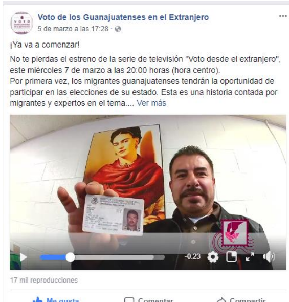
Spot promocional de la serie de televisión Voto de los Guanajuatenses Residentes en el Extranjero. Facebook, marzo de 2018.