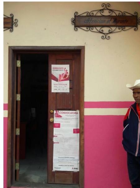
Colocación de cartel para la promoción del tema de la credencialización desde el extranjero y registro a la Lista Nominal de Electores Residentes en el Extranjero, Oficinas de Atención al Migrante, San Diego de la Unión, 22 de febrero de 2018.