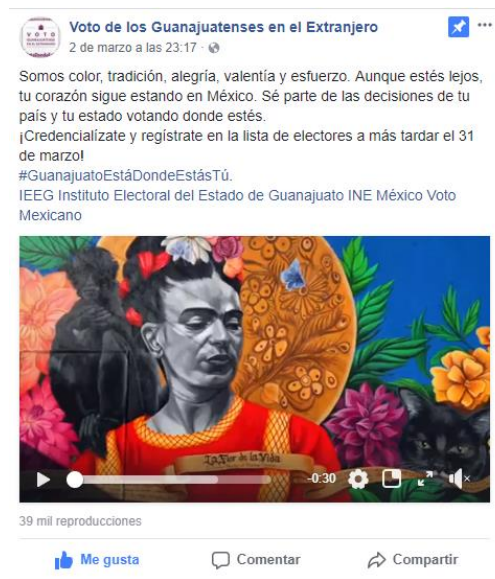
Spot promocional, Voto de los Guanajuatenses Residentes en el Extranjero. Facebook , marzo de 2018.