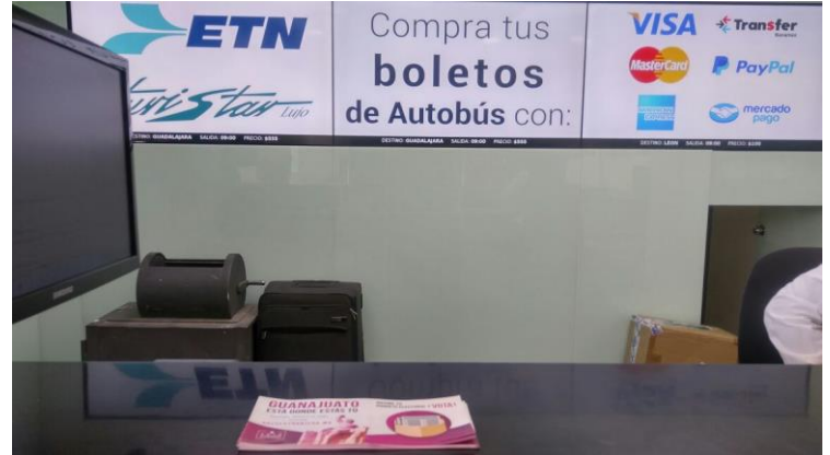
Distribución de folletos sobre el tema de la credencialización desde el extranjero y registro a la Lista Nominal de Electores Residentes en el Extranjero, Agencia de autobuses "ETN", Guanajuato, 13 de febrero de 2018.