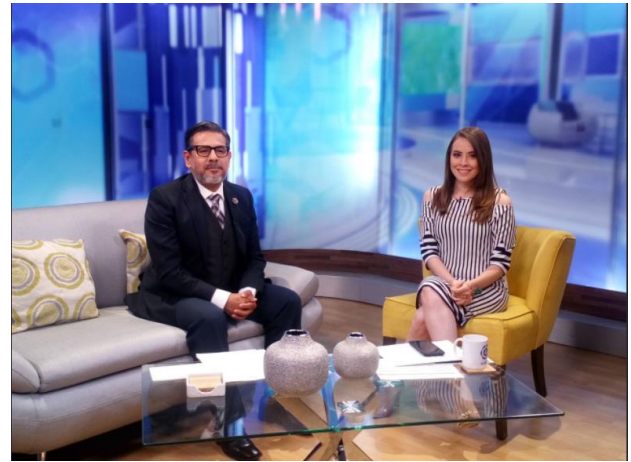
Entrevista sobre el tema de la credencialización desde el extranjero y registro a la Lista Nominal de Electores Residentes en el Extranjero, Televisora TV4, León, 9 de marzo de 2018.