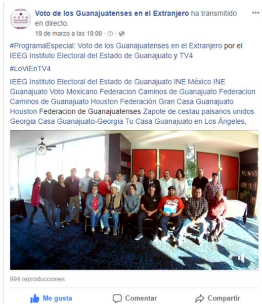
Capítulo 3 de la serie de televisión Voto de los Guanajuatenses Residentes en el Extranjero. Facebook, marzo de 2018.