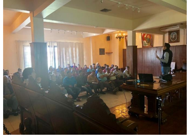
Capacitación a delegados municipales sobre el tema de la credencialización desde el extranjero y registro a la Lista Nominal de Electores Residentes en el Extranjero, Presidencia municipal, Celaya, 16 de febrero de 2018.