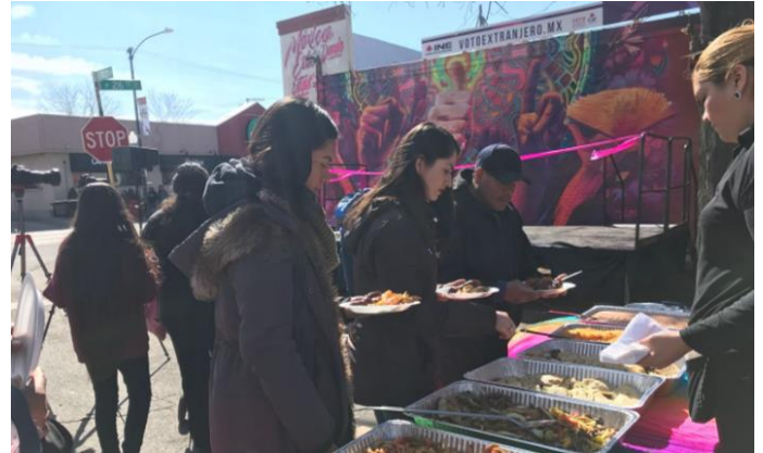
Develación Street Art, Jornada Internacional del llamado al voto desde el extranjero, La Villita, Chicago, Illinois, 17 de marzo de 2018.