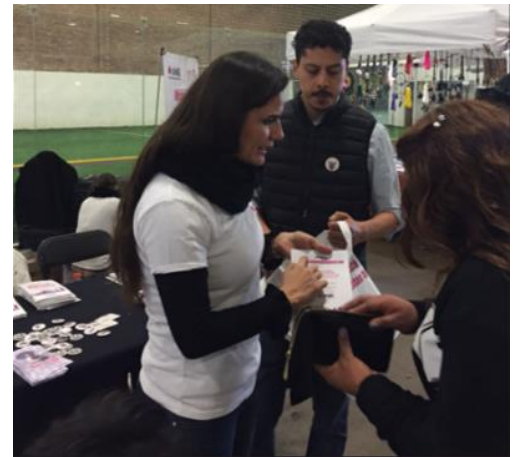
Feria de registros, Jornada Internacional del llamado al voto desde el extranjero, Carnitas Fest, Chicago, Illinois, 17 de marzo de 2018.