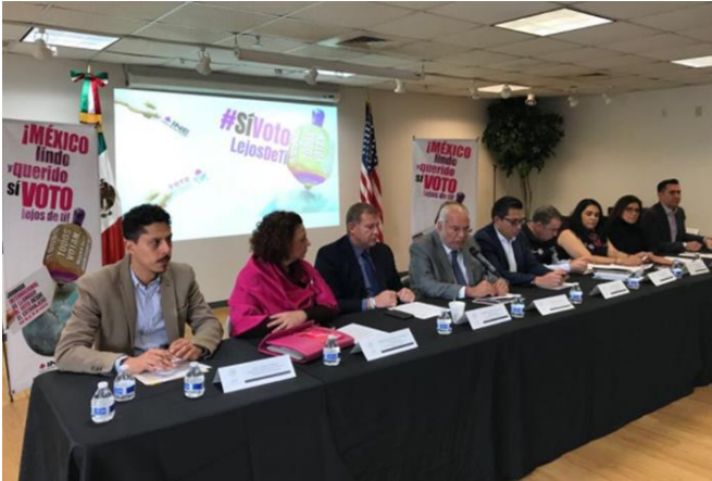
Conferencia de prensa de la Jornada Internacional del llamado al voto desde el extranjero, Consulado General de México en Chicago, Chicago, Illinois, 16 de marzo de 2018.