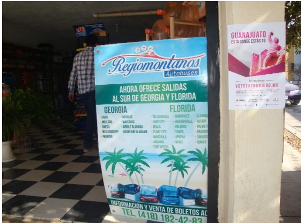
Distribución de folletos y colocación de cartel sobre el tema de la credencialización desde el extranjero y registro a la Lista Nominal de Electores Residentes en el Extranjero, Agencia de autobuses Tornado, Dolores Hidalgo C.I.N., 22 de febrero de 2018.