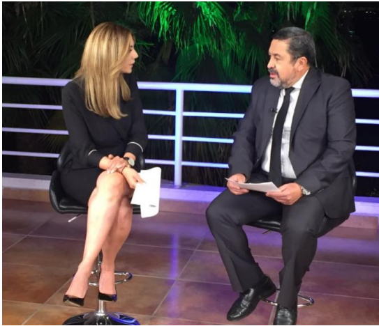
Entrevista sobre el tema de la credencialización desde el extranjero y registro a la Lista Nominal de Electores Residentes en el Extranjero, Televisora TV4, León, 7 de marzo de 2018.