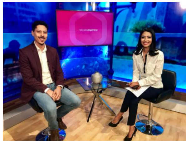
Entrevista sobre el tema de la credencialización desde el extranjero y registro a la Lista Nominal de Electores Residentes en el Extranjero, Televisora TV4, León, 12 de marzo de 2018.