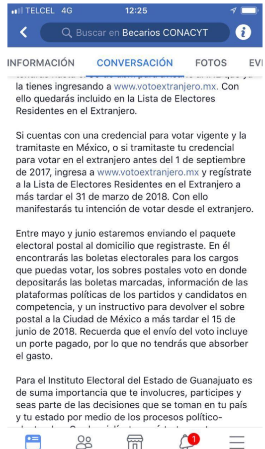
Publicación en página Becarios CONACYT, Voto de los Guanajuatenses Residentes en el Extranjero. Facebook . marzo de 2018.