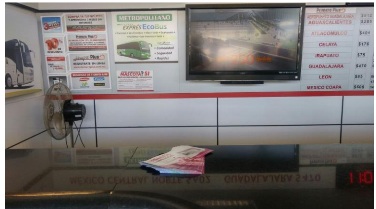
Distribución de folletos sobre el tema de la credencialización desde el extranjero y registro a la Lista Nominal de Electores Residentes en el Extranjero, Agencia de autobuses "Primera Plus", Guanajuato, 13 de febrero de 2018.